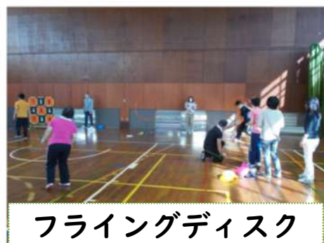
フライングディスク (アキュラシー)