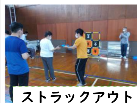
ストラックアウト