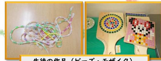
生徒の作品（ビーズ・モザイク）