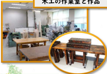
木工の作業室と作品

小学部は自分の将来に活かせる力を身につけるため、いろいろな経験を積み重ねながら学習活動を行っています。